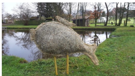
Na hrázi rybníku si hová kapr.

A pak už všichni společně začali odpočítávat a vánoční strom se rozzářil do tmy. Stejně tak se rozzářilo osvětlení budovy obecního úřadu i znaku obce opodál. Pak se všichni vydali posedět do sálu na dobré cukroví, svařák, kávu a ostatní dobroty. Především však na jarmark. V jeho pořádání nemají členky místního svazu žen konkurenci. Nabídka vánočního zboží je přeprstrá, nápaditá a ceny spíš symbolické. Členky si celou kolekci výrobků samy vytvořily, zaranžovaly a prodávaly.