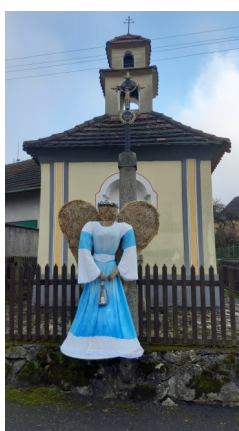
Ke kapličce opět přiletěl anděl.