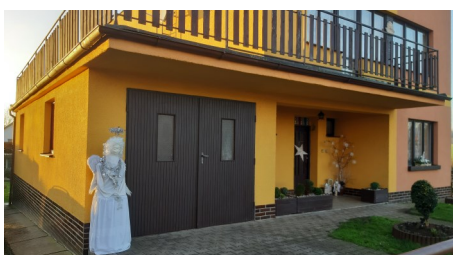
A další přiletěl před garáž k Hůlovým.