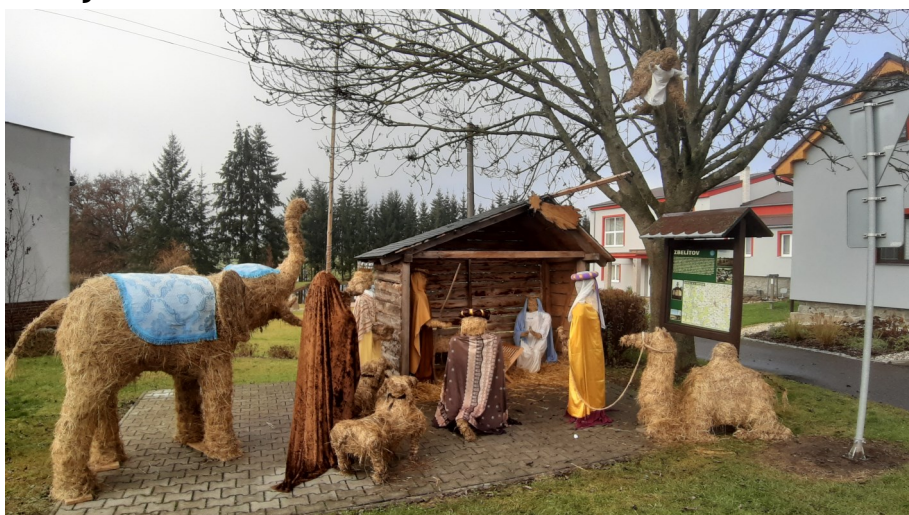
Bez betlému ve Zbelítově by Advent ani nemohl začít.

„Zbelítov je dobré místo pro žití,“ tohle si nejspíš myslí nadpozemské bytosti. Vycpané ježibaby opanovávají pravidelně závěrem dubna celý Zbelítov. Počátkem prosince za nimi nezaostává mikulášská družina, co do počtu bytostí i napáchaného hluku. O letošním adventním víkendu si Zbelítov vyhlédli hned čtyři andělé. Tři v dokonalé životní velikosti a jeden malíčký. Ten se usadil v koruně stromu nad přístřeškem s Betlémem, který tvoří postavy ze sena. V sobotu 26. listopadu u něj všichni společně rozsvěcovali vánoční strom. Při něm nechybělo vystoupení místních dětí, děti z mateřské školy a v sálu kulturního domu vánoční jarmark, skvělé občerstvení a koledy.