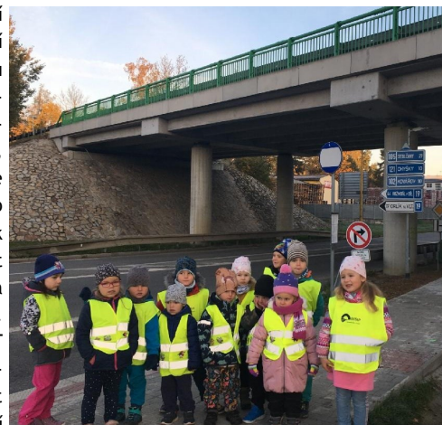
V Milevsku si děti prohlédly skutečný most.

Další součástí projektu Šablony je personální podpora školním asistentem, díky kterému máme možnost opět pro tento školní rok využívat činnost školní asistentky na čtyři hodiny denně. Z dotace MŠMT Nástroje pro oživení a odolnost - Digitální učební pomůcky, jsme poříдили dva tablety pro děti s nainstalovaným interaktivním výukovým programem iškolička. Jejich účelem je hravou formou motivovat dítě k naplňování dílčích vzdělávacích cílů a přispívat k rozvoji informatického myšlení a digitálních kompetencí dětí.