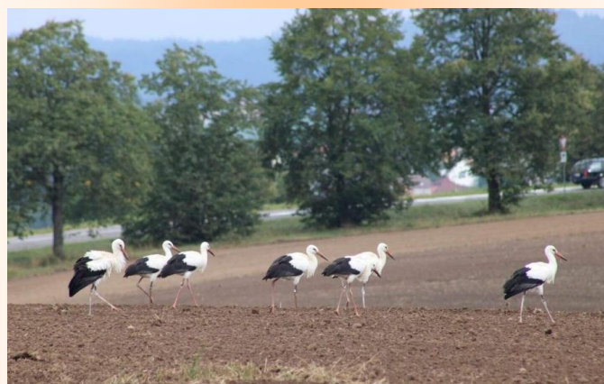
Čerstvě zorané pole nad Zbelítovem poskytlo čapům bohatou hostinu. A projíždějícím po nedaleké silnici nevšední podívanou.