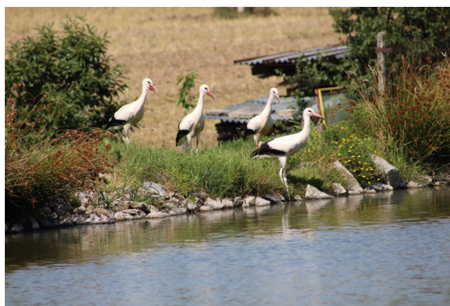
Čápátka prozkoumávala krásy Zbelítova.