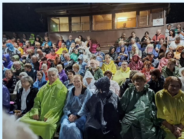
Představení Mravnost nade vše propršelo od začátku až do konce. Kdo nezapomněl na pláštěnku, měl vyhráno.