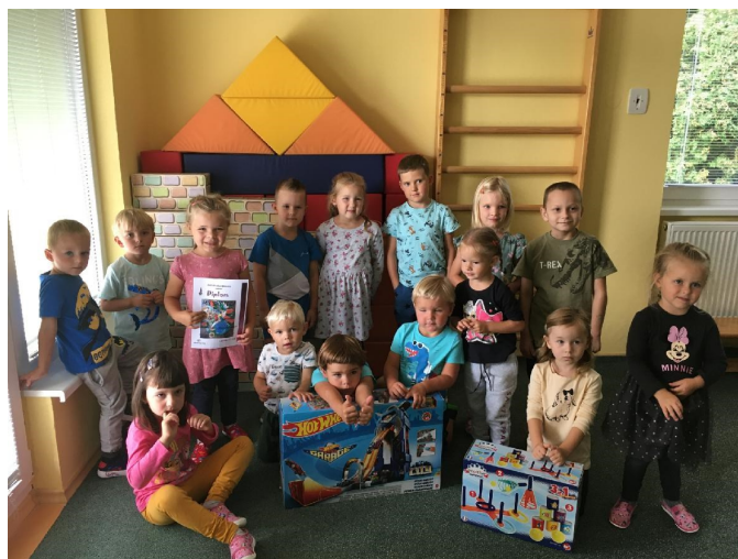
Z dárků měly děti radost.

Pro letošní školní rok 2022/2023 je do Mateřské školy Skřítci zapsáno šestnáct dětí, osm kluků a osm holčiček. Z toho předškoláků, kteří by měli za rok odcházet do školy, je sedm. Pět dětí je čtyřletých, tři tříleté a jednomu dítěti budou tři roky na podzim. Hned 1. září do školky nastoupilo patnáct dětí, z toho tři nově zapsané děti.