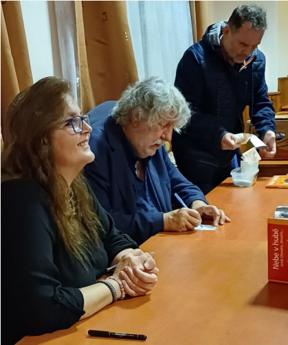
Autogramiáda obou režisérových knih.

Ve čtvrtek 16. října baval diváky ve Zbelítově známý režisér Zdeněk Troška. Pořad Úsměvy Zdeňka Trošky s písničkami Simony Klímové startoval od 19. hodiny a pořádala ho obec Zbelítov spolu s obecní knihovnou. Režisér diváky přes hodinu bavil historkami z natáčení i soukromého života. Po skončení pořadu si mohli koupit jednu nebo obě jeho knihy Nebe v hubě a Nebe v hubě 2., které podepisoval.