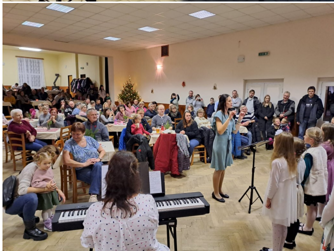
Vystoupení malých zpěvaček diváky potěšilo.