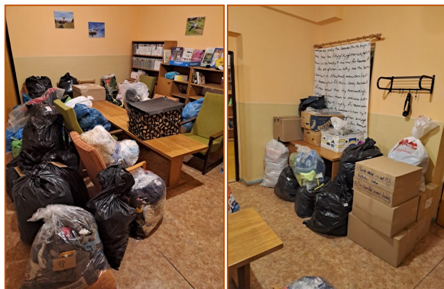
Knihovna připomínala na konci října jedno velké skladiště.