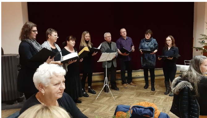
V sálu kulturního domu zazpíval pěvecký sbor Hláška ze Zvíkovského Podhradí.

bylo pro návštěvníky připraveno posezení. Nechybělo dobré občerstvení, vánoční cukroví, svařák a řada dalších dobrot. U vstupu do sálu byla umístěna kasička na dobrovolné vstupné. Členky ČSŽ jsou zvyklé přispívat na charitu a stejně tak letos. Jarmareční výtěžek 3 000 Kč putoval Domovu sv. Anežky v Týně nad Vltavou.