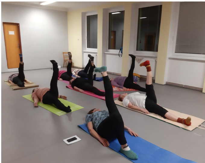
Při cvičení jógy protahují ženy všechny partie.

A jaký je v tělocvičně vlastně provoz? Pravidelně se zde scházejí příznivci stolního tenisu. Volný prostor využívají občas děti z mateřské školy pro svoji „školičku.“ V době voleb se tělocvična pravidelně mění ve volební místnost. Občas také posloužila jako místo pro konání vánočního či velikonočního jarmarku nebo tvůrčí dílničky. A třeba úplně nedávno zde probíhala výroba slona k betlému.