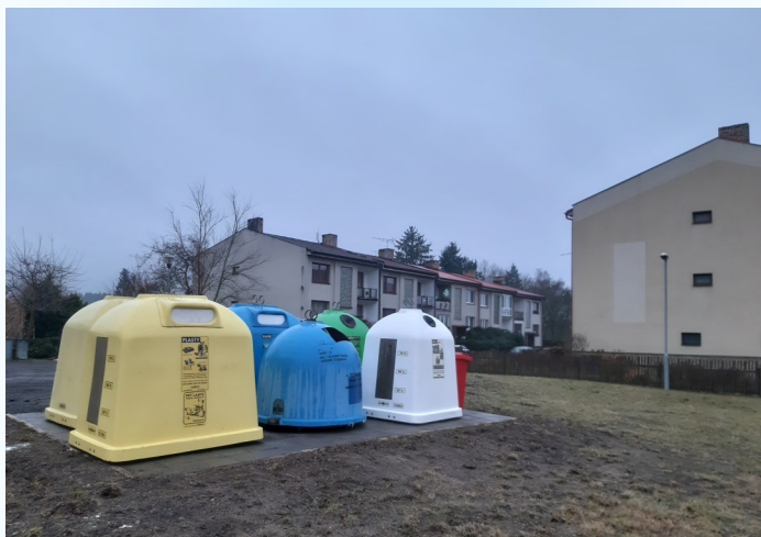
Nové stanoviště je jenom o pár desítek metrů výš.