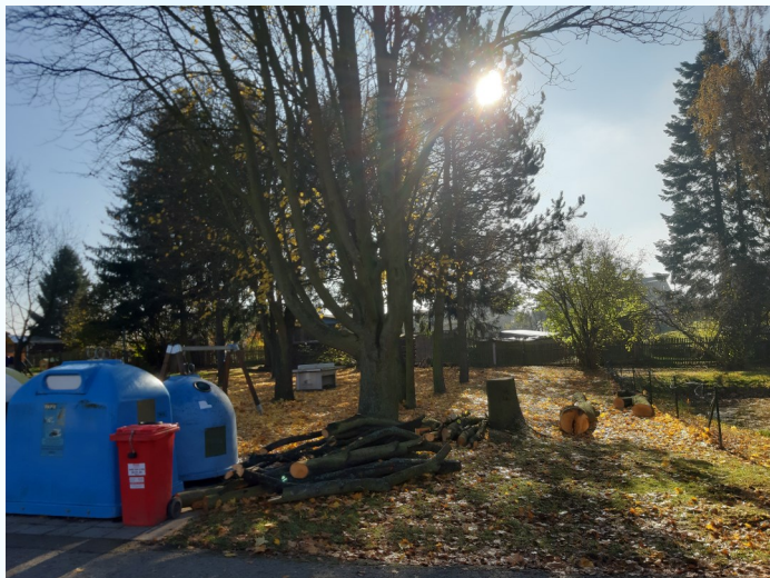
Budoucí cestě musel ustoupit strom i nádoby na tříděný odpad.

Zvony umístěné na okraji hřiště pod řadovými domy na ukládání tříděného odpadu zmizely. A chybí i jeden ze stromů, který rostl opodál. Musel ustoupit budoucí cestě, která zde vznikne. Povede k zahradě, kde se počítá s výstavbou rodinného domu. Zvony na tříděný odpad by na tomto místě bránily výhledu při výjezdu z cesty na silnici a odporovaly by tak dopravní bezpečnosti. Byly proto kompletně přestěhovány o několik desítek metrů výš na volné prostranství, tzv. točnu nad řadovými domy.