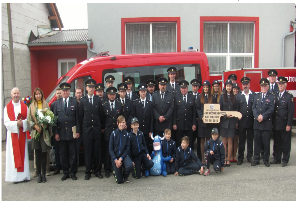
Hasiči v plné parádě s novým vozidlem a přívěsem

nákladní avie s plachtou. Spolu se stříkačkou a ostatním materiálem se vezlo na korbě avie i celé soutěžní družstvo. V roce 2003 Obec Zbelítov zakoupila od ZVVZ Milevsko starší skříňovou avii Furgon. Hasiči ji společnými silami poupravili a výjezdy byly hned snazší. Nyní už její stav přestal odpovídat povinným parametřům. Koupit nový automobil si obec dovolit nemohla, avšak požádat o dotaci ano.