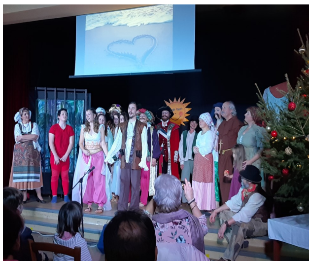
Závěrečná děkovačka herců

Do sálu kulturního domu se v sobotu odpoledne usadilo přes sto diváků. Herecké výkony doprovázené zpěvem byly jednoznačně přesvědčivé, zábavné a skvěle zahrané. Není divu, že se děti i dospělí ponořili do děje tak, že zapoměli na čas. Představení doprovázela živá kapela a písničky ze známé pohádky si tak chvílemi s herci a orchestrem zpívali i diváci. A stejně jako pokaždé předtím, dopadlo všechno dobře i tentokrát. Lotrando si odvezl Zubejdu domů, vzal za ženu a měli děti jako smetlí. Filmovou pohádku Lotrando a Zubejda natočil režisér Karel Smyczek se scenáristou Zdeňkem Svěrákem v roce 1997 a řadí se k nejoblíbenějším pohádkám. Kovářovská OPONA ji dle této předlohy nastudovala skvěle.