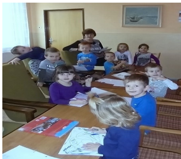
Děti na návštěvě v knihovně

Vykrajování a zdobení perníků si pak děti také samy ve školce vyzkoušely při přípravě vánočního dárku pro rodiče v podobě perníkového svícnu i perníčků na ochutnání a výzdobu při předvánočním setkání s rodiči a prarodiči dětí ve školce. Ti byli pozváni na tradiční besídku, kde děti ukázaly, co se ve školce nau-