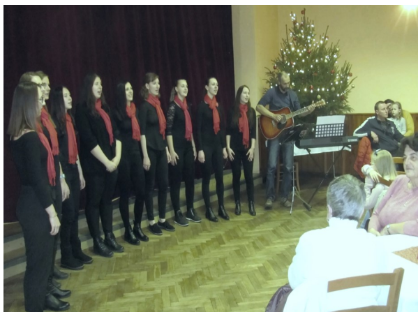
Mil-Roses diváky nadchly

Pro děti byla v sálu k dispozici výtvarná dílnička. Mohly si tak vlastnoručně namalovat nebo vymalovat obrázek. A nechyběla ani Ježíškova nebeská pošta. Stačilo na lísteček napsat přání, vhodit do schránky a úspěch měl být zaručen. A že to tak nějak funguje, potvrdila i jedna z pořadatelek. Před pár lety si jedna vdova napsala na lísteček, že chce nějakého chlapa. A, světe div se, osud jí ho do života poslal. Inu, až čas ukáže, jak to s letošními přáníčky dopadlo. -et-