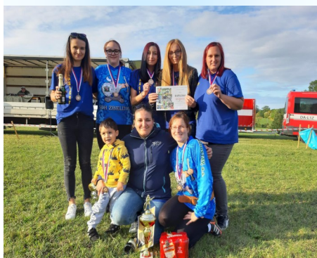
Zbelítovská děvčata skončila bronzová