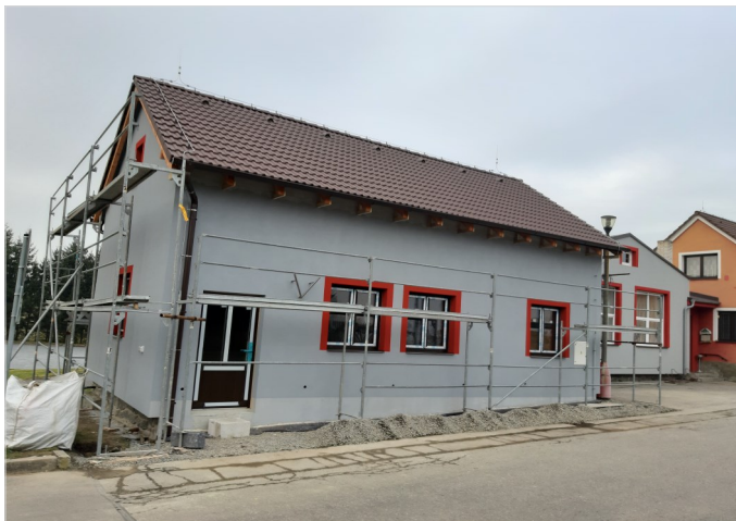
Zrekonstruovaná budova těsně před odstraněním lešení