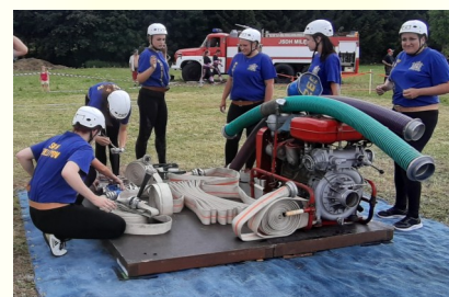
Zbelítovské hasičky