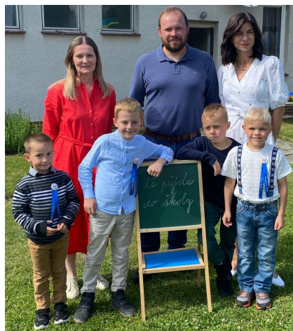
Rozloučení s předškoláky, kteří půjdou v září do školy.

Velkým zážitkem byl autobusový výlet do Perníčkovny U Radešinka v Počepicích. Prohlídka byla spojená s výkladem a ukázkou výroby, ochutnávkou a vlastním zdobením perniček. Součástí programu byl i pobyt v interaktivní herně, kde si děti užily spoustu zábavy. V rámci poznávání světa zvířat jsme uspořádali vzdělávací setkávání zaměřené na respekt k živým tvorům a správnou péči o ně. Při zážitkovém programu Venkovské pohlazení nás ve školce navštívila ovečka a morčátka. Děti si je mohly pohladit, nakrmit a dozvědět se o nich mnoho