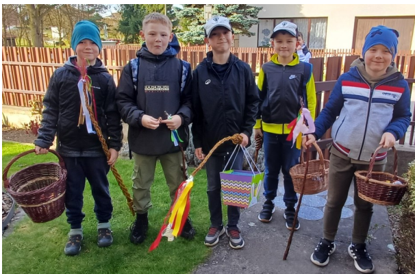
Hody, hody doprovody, dejte vejce malovaný...