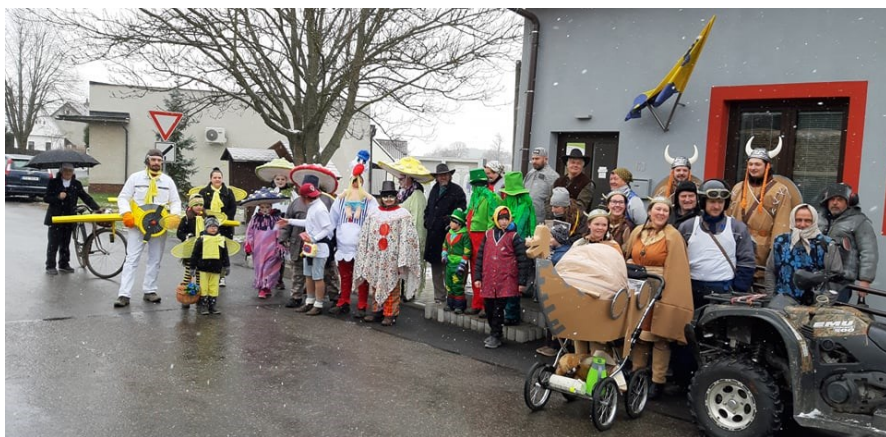
Na startu se maškary společně a pěkně zvesela vyfotografovaly.