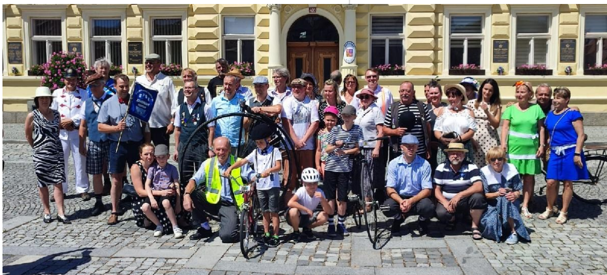
V Milevsku před radnicí se velopedisté společně vyfotografovali.