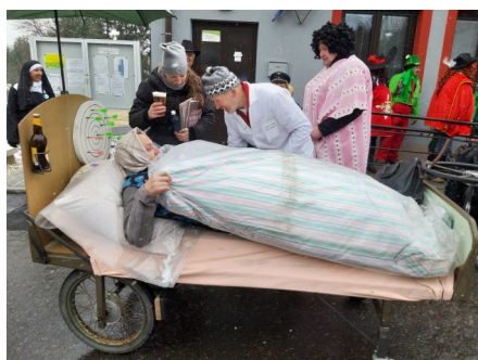
Postel s bábou vzbuzovala veselí.

Maškarní taškařice nesla název Veselý aprílový průvod masek s muzikou a delegací z Hoštic. Po roční covidové přestávce proběhl už třetí ročník. Převládaly postavy z Troškovy komedie Slunce, seno, jahody. Na Jawě 350 přijel Venca Konopník i s Kelišovou. Nechyběly soudružky družstevnice, žvýkající předseda JZD Rádl, Šimon Plánička ani farář