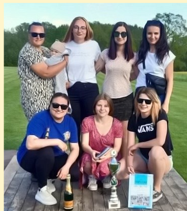
Vítězný tým zbelítovských děvčat.

V sobotu 14. května se v Hrejkovicích konala Okrsková soutěž v požárním útoku okrsku Milevsko.