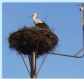
Na hnízdě 30. dubna o čarodějnicích