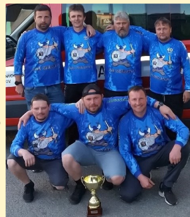
Vítězný zbelítovský tým seniorů.

Druhé družstvo zbelítovských hasičů mužů skončilo na třetím místě.