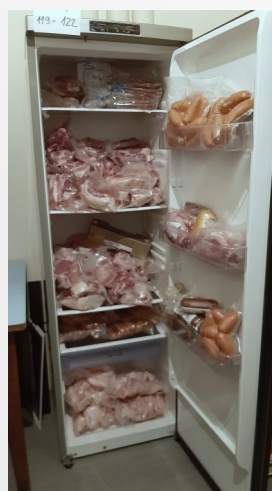
Pohled na lednici plnou masa a uzenin se jen tak nevidí.

Členky ČSŽ velmi děkují všem sponzorům, kteří svými věcnými nebo finančními dary přispěli do tomboly. -et-