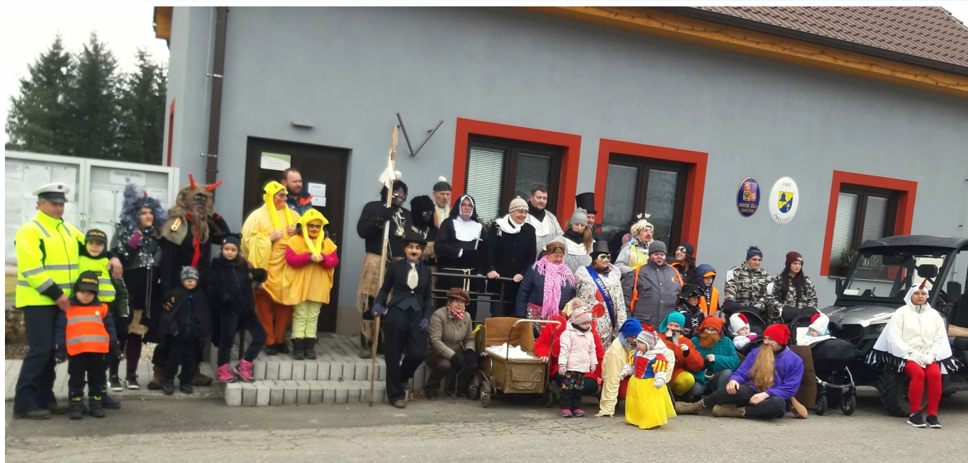
Nejprve se všichni společně vyfotografovali a pak už průvodem pěšky i na vozech hurá po vesnici.

V sobotu 11. února odpoledne táhl Zbelítovem maškarní průvod. Nechyběla v něm živá muzika, alegorické vozy a přes 40 rozličných masek. Počasí bylo příznivé, ale chvílemi maškary trápil ledový vítr. Na několika zastávkách jim tak vhod přišlo horké občerstvení a příjemné závětrí. K máni byla káva, čaj, grog, panák na zahřátí, koblihy, štrůdl, ale i chleba se sádlem a cibulí.