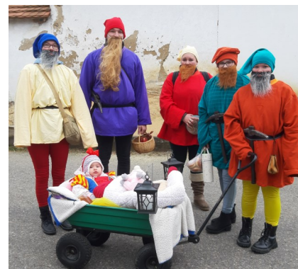
Pět trpaslíků se Sněhurkou, šestý se přidal až později (byl v práci).

si spokojeně hověla v kočárcích. Tlačily je agentky pro sčítání ptáků. „Za každého ptáka účtujeme panáka,“ hlásil nápis na zádech.